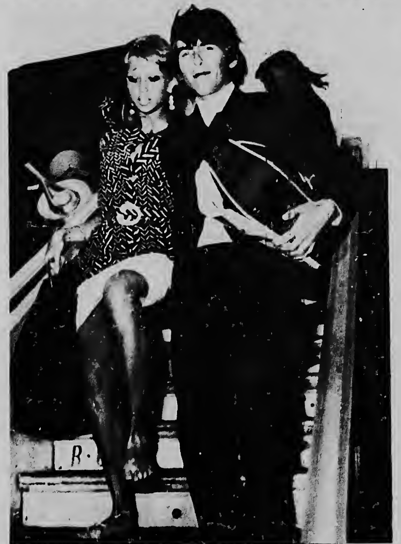
George Harrison huntu cu su casá Pattie Boyd, ex modelo, a yega Londres den un awaserru fuerte despues di a termina nan luna de miel na Barbados. Harrison ta toca den The Beatles.

E reunion di ayera cu a dura 25 minuut, tabata asisti pa prome secretario di estado George Brown, ministro di trabao, Ray Gunter, y ministra di transpor- tes, Sra. Barbara Castle. Na su turno el a bisa cu no tin anuncio sino te dialuna riba e asunto di fecha dje eleccionnan. E atardi ei mes Wilson a biaha pa du dis- tricto electoral na unda nan a com-